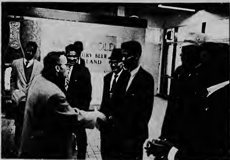
Hefe di personal Van Glis ta jama e trahadornan Antillano bonbini na Schiphol na nomber di directiva di e fabrica.

Precies enfrente di e complex Balamundi ta keda e establecimiento di Philips di Huizen, na unda tambe tin algun Antillano ta traha. Pues pronto e nobatonan lo tin contacto cu e "old-timers" nan. A pesar